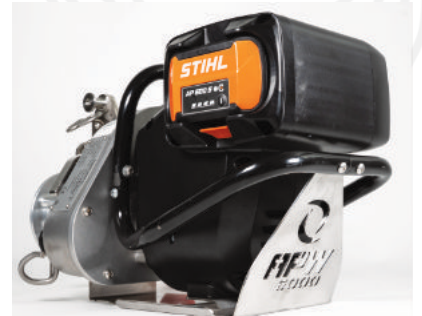
Motore con coppia istantanea da 3,0 kW