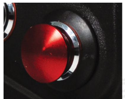
Sistema di arresto di emergenza e bloccaggio del tamburo